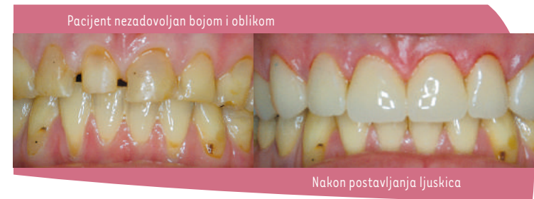
Pacijent nezadovoljan bojom i oblikom

Kod pacijenata kojima nedostaju svi ili veliki broj zuba i nema mogućnosti za izradu mosta, izrađuju se totalne ili djelomične proteze koje također mogu biti poduprte prethodno usadenim implantatima. Kada vam se ne sviđa oblik ili boja Vašeg zuba, bilo da je prirodno takav ili je kroz dugi niz godina potrošen škrgutanjem ili je odlomljen, možemo za Vas izraditi tanke keramičke ljuske koje prekrivaju samo prednju površinu zuba i daju Vam izgled i boju zuba kakvu želite.