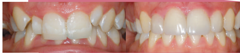
Zubi prije ortodoncije

Ortodontska terapija može biti uspješna u svakoj dobi, a odrasli osobito cijene terapiju zbog kreiranja lijepog osmijeha. Ortodontske bravice nisu više samo za djecu. Ortodontska terapija u starijoj dobi može poboljšati samopouzdanje i izgled, no poboljšavanje zdravlja zubnog mesa i zuba je jednako važno. Iskrivljeni zubi i loš zagriz mogu doprinijeti gubitku zubnog mesa i kosti, karijesu i nepravilnom trošenju zubne supstance. Naprave i tehnike koje se danas koriste smanjuju nelagodnost, smanjuju učestalost kontrola i omogućavaju vam da izaberete između nekoliko vrsta bravica.