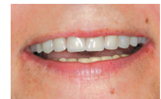
Fiksni most na implantatima